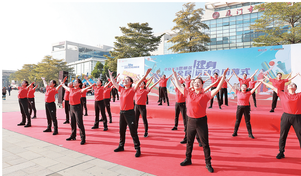
闭幕式展演节目精彩纷呈。

值得一提的是,本届运动会打造了青少年喜爱的“奔跑吧少年”系列体育品牌赛事,社区居民喜爱的“运动健身进万家”社区运动会,老年居民喜欢的广场舞、健身气功等老年人品牌赛事,广受欢迎的村居篮球赛、气排球等群众体育品牌项目以及新兴的沙滩