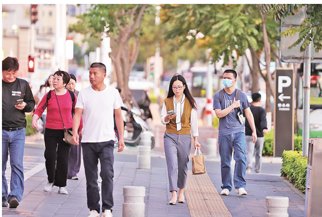
昨日气温较高,一些市民穿上夏装出行。

不过,湿热天气马上就要画上了句号。气象专家表示,冷空气“先头部队”今天就会抵达厦门,温暖湿润的偏南风转为寒冷的北风,厦门气温将出现明显下降,两天以内降温可能超过10℃。今天白天,市区最高气温降至24℃左右,最低气温在