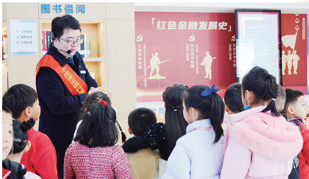
厦门建行金融教育基地开展“阅读+消保”宣传活动。