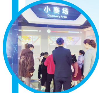
金融教育基地小赛场区域配备了互动体验设备。

当您看到有使用存款保险标识的金融机构,就代表其已经参加了存款保险,您的存款受到国家法律保障。中国建设银行吸收的所有本外币存款依照《存款保险条例》受到保护。