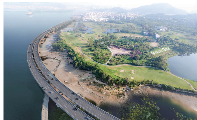
海沧鳌冠大道工程效果图。

社会事业类项目方面,象屿智慧供应链产业园停车场、公寓配套项目近日开工建设,项目位于海沧区,总用地面积约1.3万平方米,总建筑面积约3.2万平方米,建设内容包括保障性租赁