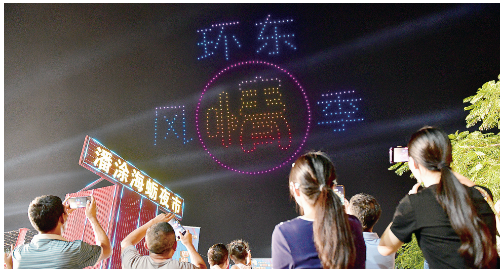
融入同安文化元素的无人机灯光秀表演深受市民喜爱。

文化是旅游的灵魂,旅游是文化的载体,同安充分挖掘优秀传统文化的资源价值,让人们在文旅活动中不断感悟同安传统文