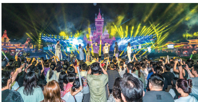
2023年“环东风情季”电音啤酒节受市民游客欢迎。(资料图)

2024厦门国际啤酒节将在7月底推出,持续举办15天,在20多万平方米的滨海场地里,将汇聚全球知名啤酒品牌及精酿