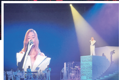
◁ A-lin 黄丽玲6月在厦门凤凰体育馆开唱。