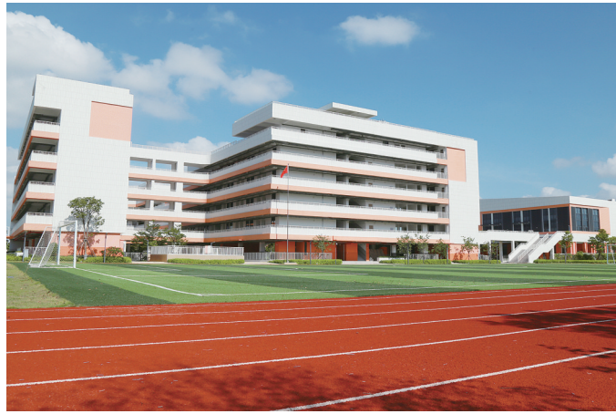
大嶝中心小学阳塘校区。

记者还了解到,大嶝中心小学现有三个校区,该校秉持全岛“一盘棋”的思想,通过科学调配师资,确保各校区师资力量的均衡配置,同时在管理团队、管理机制、教师配置、教育资源等方面开展“一体化办学”管理探索,实施一体化管理。今后,阳塘校区也将在大嶝中心小学带领下,紧扣“以人为本,服务育人”的办学理念,全力建设成为“平安、人文、智慧、绿色”校园。