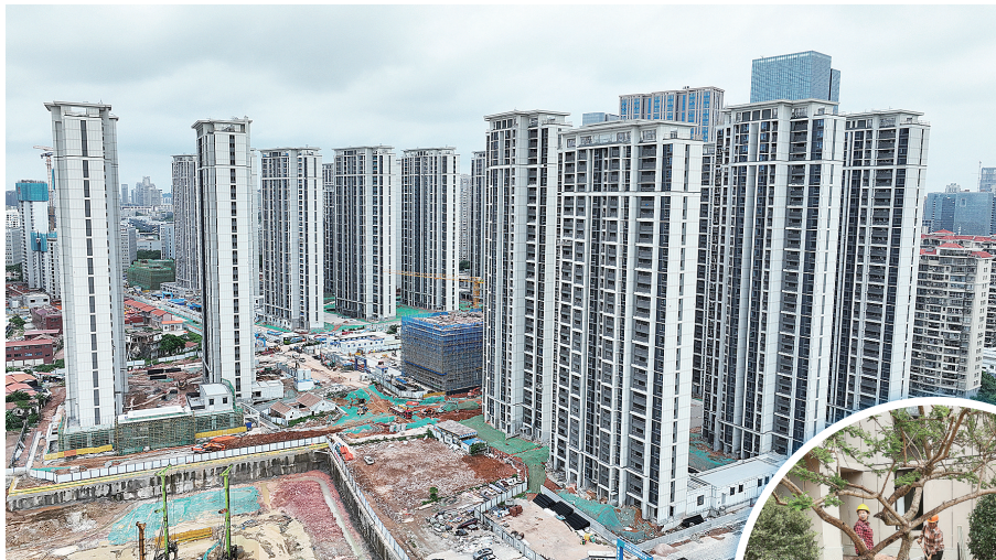
何厝安商房项目航拍图。