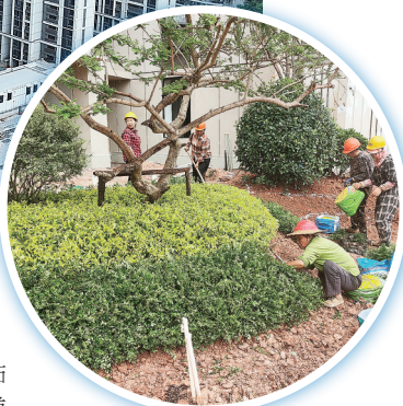
在岭兜安商房项目，施工人员正在进行室外景观施工。

代建单位厦门兆旭建设发展有限公司工程项目部管理人员表示：“为确保项目竣工验收能如期进行，我们进一步明确目标，不断完善项目建设施工方案，科学组织施工，调整作息时间，采取‘抓两头、歇中间’的避高温措施，尽量避开中午的高温时段，利用好气温较低的时间段作业，确保高温下施工安全、人员安全，倾情