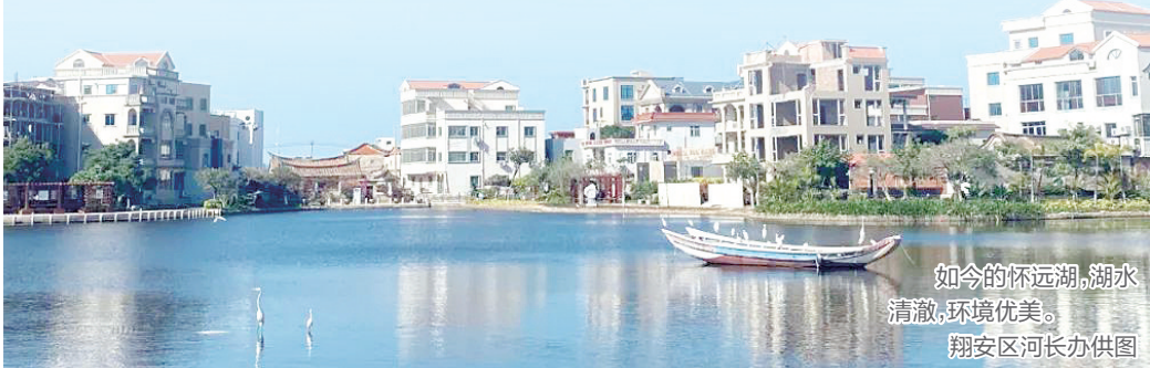
如今的怀远湖,湖水清澈,环境优美。

据了解,2024年,厦门市统筹推进水资源、水环境、水生态治理,流域水质不断提升、水环境得到改善,全市集中式饮用水水源地优质水比例100%,同比上升12.5个百分点;主要流域国考断面水质优良比例100%,优质水比例50%,同比上升16.7个百分点。