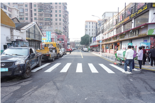
改造改造,原本破损的路面焕然一新。

为保障市民、游客安全出行,在此次提升改造过程中,思明区市政中心还在沙坡尾避风坞木栈道周边9个路口新增了“U”型护栏,杜绝电动车随意进出。