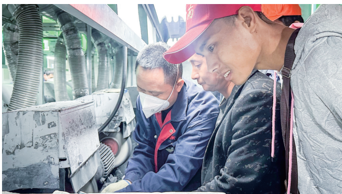
永德县务工人员到鹏威(厦门)工业股份有限公司生产车间学习。