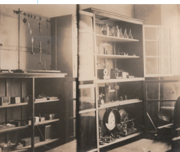
同文物理实验室及打字教室。