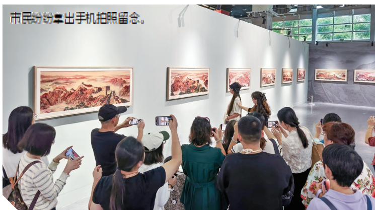
市民纷纷拿出手机拍照留念。

从壁画创作的角度来看,《长城颂》很好呈现了壁画的很多特殊属性。在建筑空间属性上,这个壁画非常注重和建筑有机融合,壁画颜色与序厅地面颜色形成关联。在宏大性上,这件作品不仅尺幅宏大,表现主题也具有宏大性。在工艺材料多样性上,作品选择以漆材料来制作。在工艺性和长久性上,注重与建筑紧密结合,形成共生关系。在时代性上,这幅壁画有非常多技术突破,比如利用现代影像技术辅助创作;在漆艺创作中,用蜂窝铝板取代传统木胎底板,对漆面进行哑光处理等,为未来大型漆壁画创作开拓了新的路径。