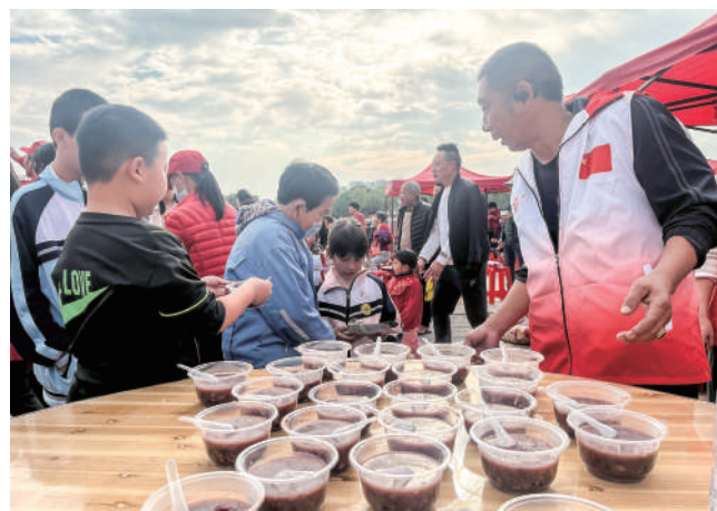
工作人员向居民分发腊八粥。

甜蜜的腊八粥、喜庆的文艺演出、丰富的公益活动……现场粥香满溢、载歌载舞,吸引了数百名居民前来。大家一边欣赏着民俗文艺汇演,一边品尝着热腾腾的腊八粥,脸上都露出了幸福的笑容。值得一提的是,溪边社区还将腊八粥送到了行动不便的老年居民家中。