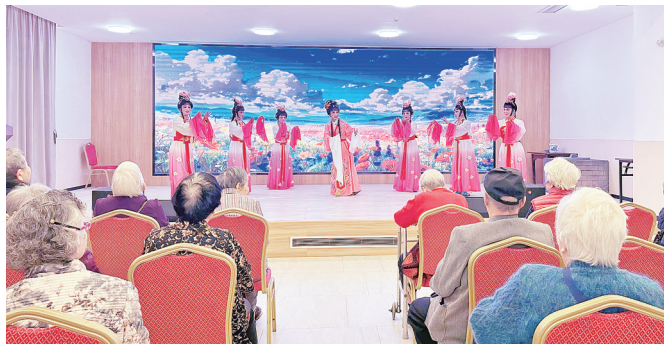
翔安吕塘戏曲学校带来高甲戏《赏花》。

不少“文联服务点”举办了精彩的非遗主题讲座。在厦门市爱心护理院, 翔安吕塘戏曲学校为医护人员和在院长者们带来了多个高甲戏演出, 让他们体验闽南