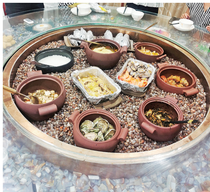
用玛瑙石加热食物,制作的“玛瑙餐”别具风味。

负责人介绍,众创平台的出现,不仅打开了玛瑙销售的新思路,还带动了大量的人流量。众创平台还将通过精细化融合创业战略,有效整合专家、资本、生产、市场、