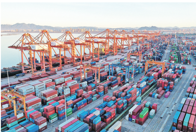
随着物流行业快速发展和科技不断进步,厦门供应链发展水平持续提升。

面积极探索创新,强化供应链管理,发展先进供应链管理技术,实现企业供应链精准化、高效率、高价值发展,提升了厦门供应链发展水平。