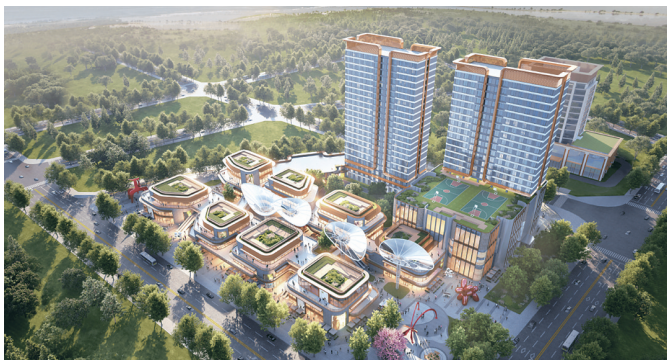
马銮湾新城霞阳社区霞阳东侧集体经济项目效果图。

施工单位厦门海投工程建设有限公司相关负责人介绍:“A地块项目正处于桩基施工阶段,计划年内完成主体结构封顶,预计2027年建成投用。目前已经设置421根止水帷幕搅拌桩,场地内正在进行静压管桩施工等相关建设工作。”