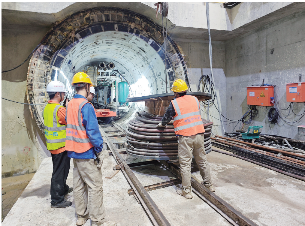
厦门电力与清水进岛隧道施工现场一派热火朝天的景象。

项目负责人介绍,项目自2022年7月开工以来分段推进。项目建成后,将与周边主干路网有效衔接,完善区域交通体系,改善凤岗、古庄、田洋等片区出行条件,缓解同安老城区交通压力,并带动沿线片区开发建设、提升城市承载能力。