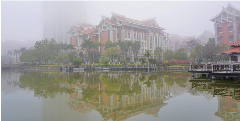
昨日早晨,集大校园被雾笼罩。

务,取得综合所得无扣缴义务人,造成纳税年度少申报或者未申报综合所得的。值得一提的是,符合“年收入不超过12万元”或“补税金额不超过400元”条件的纳税人,可免于办理汇算。