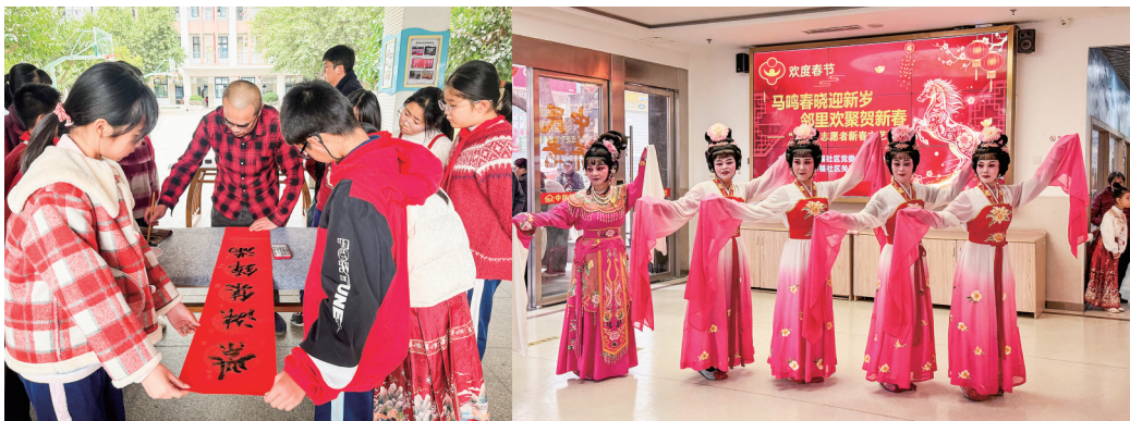
▲ 书法家们在同安区洪塘头小学送福写春联。

在华福社区,翔安吕塘戏曲学校的表演者参与社区志愿者新春文艺汇演,带来高甲戏经典选段《赏花》,通过对话和动作表达