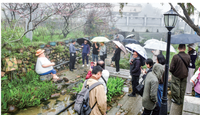
采访团调研走访军营村九龙溪,了解生态治理成果。

调研采访团先后来到白交祠村村部、地质灾害安置房项目现场,了解党群服务中心提升改造情况与民生保障项目建设进展;走进军营村九龙溪,水清岸绿、景致宜人,生态治理成效显著,长者食堂暖意融融,公共服务持续提质;在高山生态茶园,万亩茶园绿意盎然,茶旅融合带动村民增收,特色民宿等旅游业态蓬勃发展,农文旅融合路径清晰。