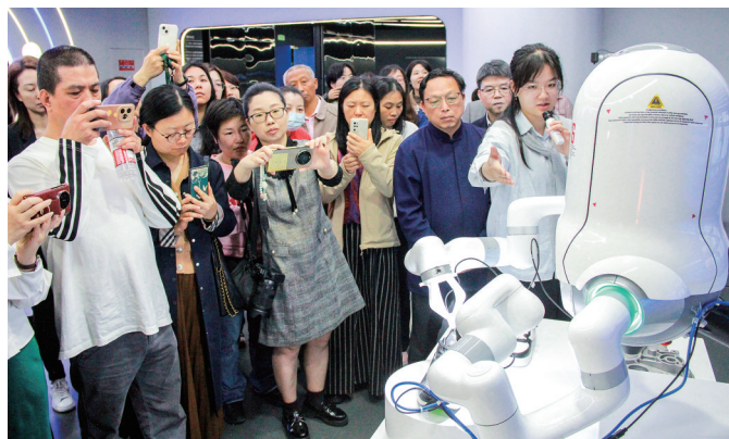
文艺工作者深入了解人工智能前沿技术发展及产业应用。

晨报讯(记者 邱乐)近日,厦门市文联与思明区文联共同组织机关党员及各文艺家协会党员代表,前往思明智算中心与百度飞桨(厦门)人工智能产业赋能中心进行实地参观与学习交流。此次活动旨在深入了解人工智能前沿技术发展及产业应用,探索科技赋能文艺创作、推动文化事业创新发展。