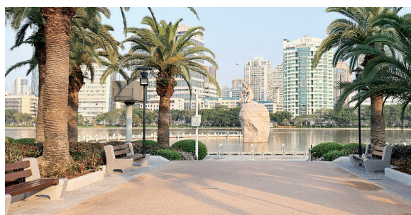
本次新增的便民设施位于白鹭女神像周边区域。

对于此次新增的便民设施,不少市民纷纷点赞。市民林先生认为,置物架的设置十分贴心,晨练或拍照时可临时放置物品,既方便又实用,希望今后能看到更多类似的便民设施。